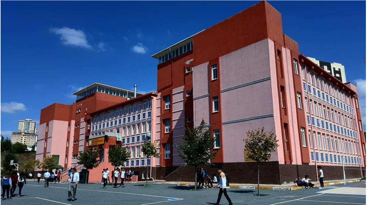
Okul ön cephe ve girişi